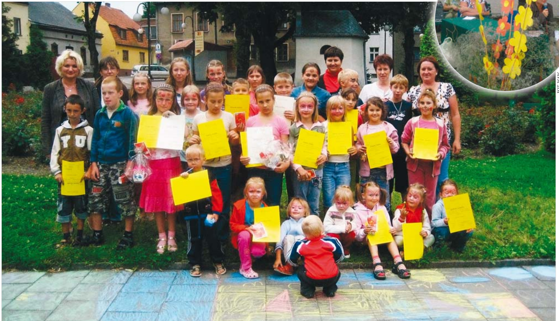
Pamiątkowe zdjęcie uczestników imprezy

W imprezie zorganizowanej przez Zespół Świetlic Opiekuńczo-Terapeutycznych oraz gminną księżnicę wzięło udział czterdzieści dzieci.