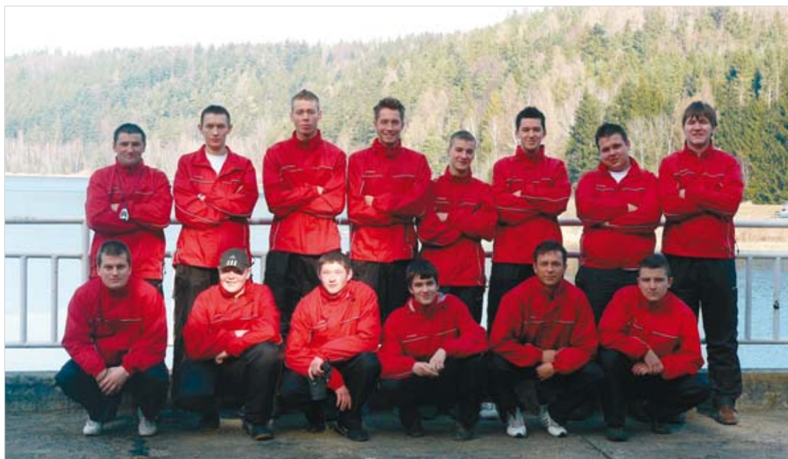
Zgrupowanie w Kruzbierku