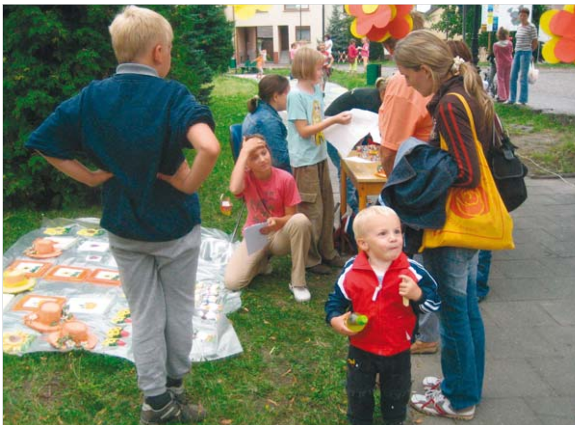
Stoisko - prace dzieci